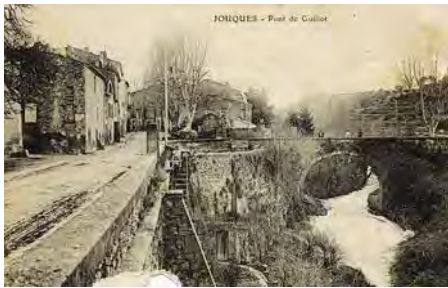
Sur cette vue du pont de Guillot on peut distinguer une terrasse où le blé était séché après lavage à la fontaine avant de passer dans le moulin à farine situé en face sur le boulevard.

Source d'émerveillement au printemps quand il baigne les iris jaunes mais aussi d'inquiétude en période de sécheresse, le Réal est indissociable du village. D'où vient-il ? Quelle a été sa place dans la vie économique de la commune ? Venez le découvrir au musée.