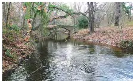
Jouques en hiver : un pont sur le Réal.